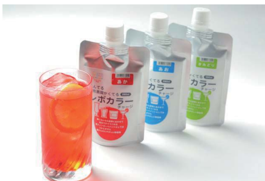
■レボカラーチャージ