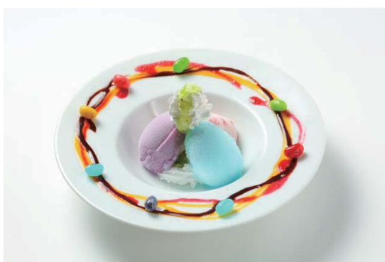
■ひんやりジェラート きらり