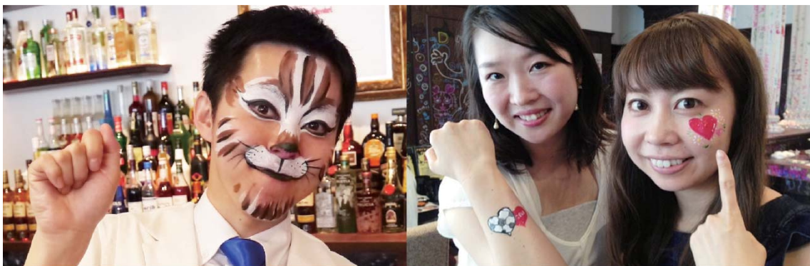
昨年のフェイスペインティングイベントの様子

イベント開催日は、9月19日(土)パーティタイム、10月10日(土)パーティタイム、10月30日(金)パーティタイム、10月31日(土)カフェ&パーティタイムを予定しています。※詳細は http://pentel-rakugaki.jp をご参照ください。