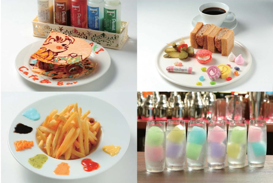
左上から RAKUGAKI たこ焼きせんべい、RAKUGAKI CAFE セット、フレンチフライポテト パレット STYLE、ぺんてるソニック

フード&ドリンクメニューは昨年から進化しました。ソースでらくがきを楽しめる「RAKUGAKI たこ焼きせんべい」や、クレヨンの様なチョコが付いた「RAKUGAKI CAFE セット」などを新たにご用意。また昨年大好評だった絵の具をパレットに見立て、7色の虹色ソースで楽しむ「フレンチフライポテト パレットSTYLE」や、パステルカラーに彩られたカクテル「ぺんてるソニック」などは今年もご用意しています。ぺんてるらしいメニューで、味も見た目もお楽しみ頂けます。