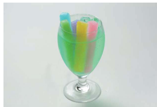
■5色セットクーラー