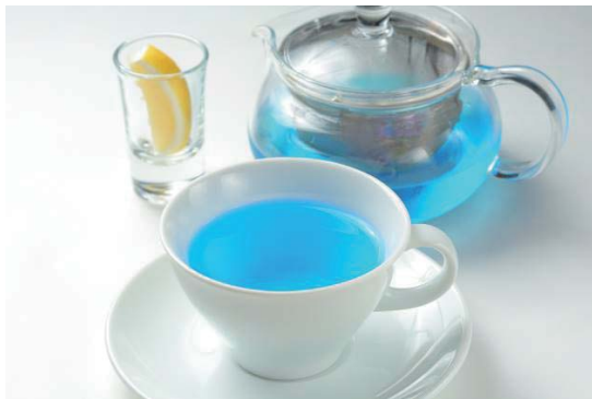
■マロウブルーティー