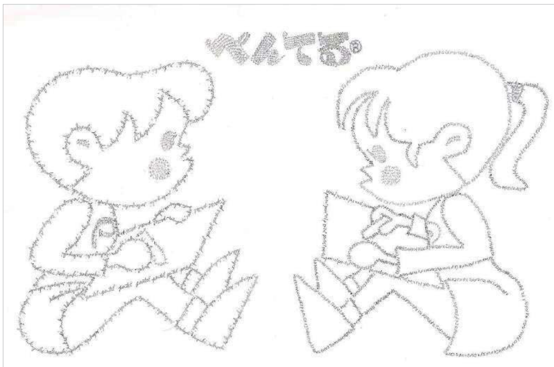
ペペ&ルルの超極細イラスト

店内には、特殊技能を持ったぺんてる従業員による超極細イラストを展示しています。これは超極細シャープペンシル「orenz(オレンズ)」の0.2mm芯で描かれたものです。イラストのモチーフはぺんてるクレヨンでお馴染みの「ペペ」と「ルル」。ぺんてる製品による表現の無限の可能性をご覧ください。 ※このイラストにらくがきすることはできません。