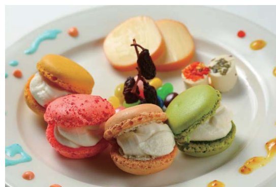
■マイカラーマカロンとチーズの盛り合わせ