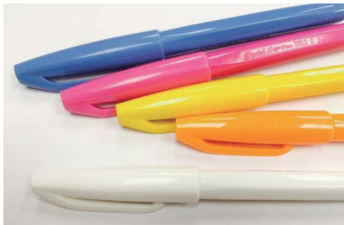
ワークショップの際に使用するペンてるサインペン

※ワークショップは事前予約制となっております。 ※詳細は http://pentel-rakugaki.jp をご参照ください。