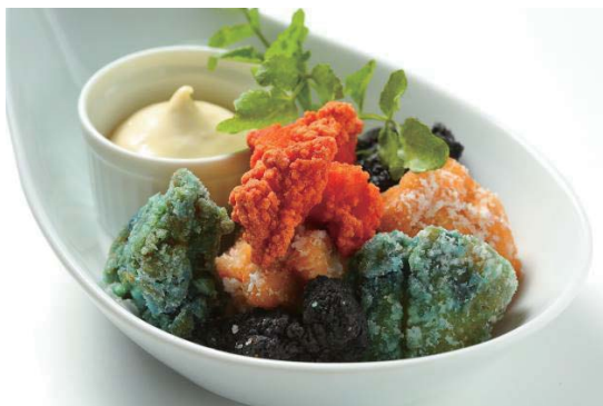
■4色食べ比べ!カラフルトリカラ