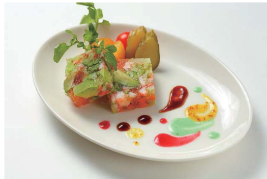
■テリーヌ・ドゥ・フレンチポップ