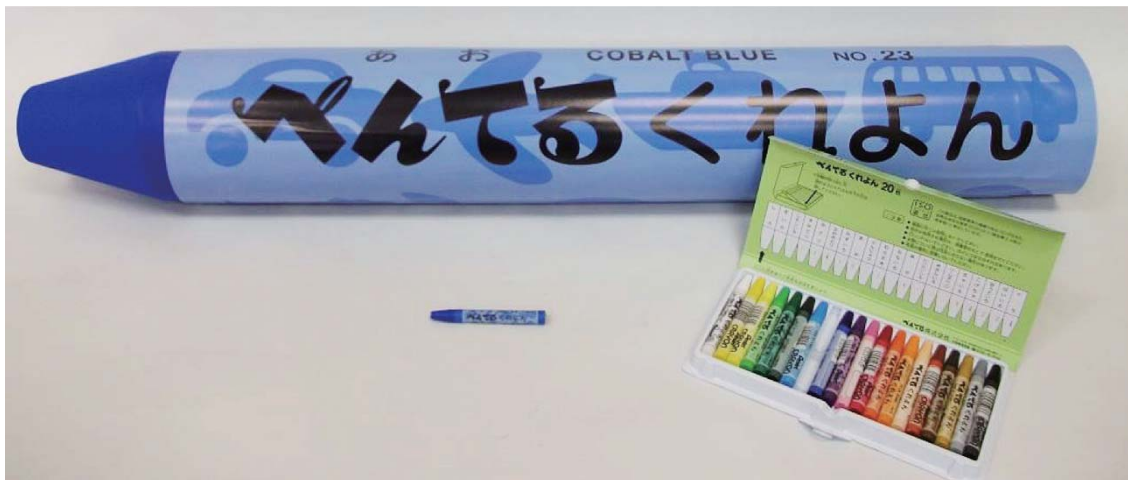
巨大クレヨンと通常のクレヨンの大きさ比較