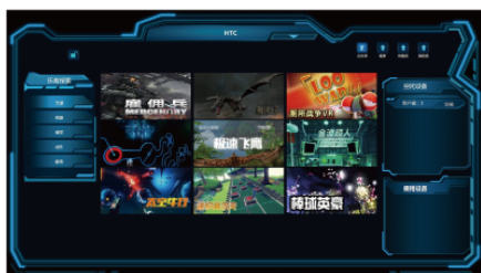
VR・eSportsプラットフォーム