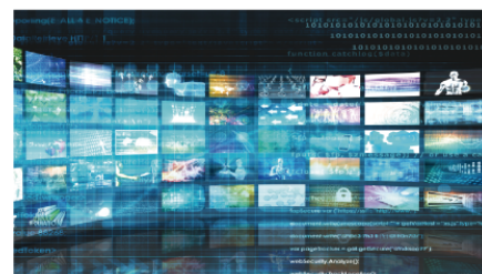
VR・eSports大会のライブ実況/配信