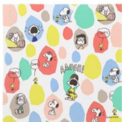
品番 : Z0222009_5101