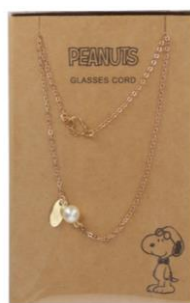
品番 : Z0223004_56F1