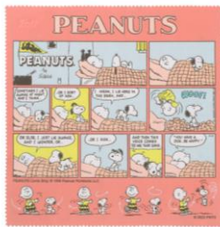
品番 : Z0222009_2101

PEANUTS らしいコミックアートのデザインや人気のあるカラフルなアート、男性にもおすすめできるブルー基調の 3 種を新パッケージで。本体とパッケージにリサイクル素材を使用しました。