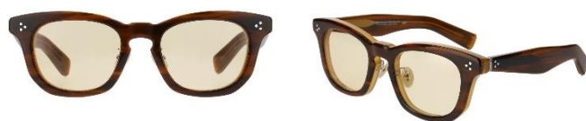
ZF231G11_43A1 (ブラウン×ライトブラウンレンズ)