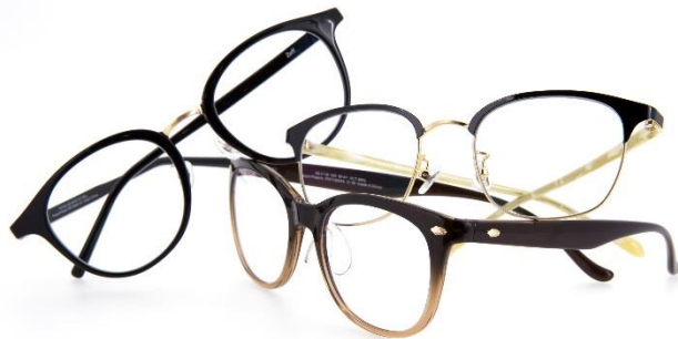
紫外線 100%カットの「Zoff UV CLEAR SUNGLASSES」は 3,500円（税別）～のラインアップ

メガネブランド「Zoff」を運営する株式会社インターメスティック（本社：東京都港区）は、業界最高のカット率を誇る UV100%カット※の透明レンズを搭載した「Zoff UV CLEAR SUNGLASSES」（3,500円[税別]～）を3月中旬に発売します。紫外線を目から吸収すると、シミ・そばかすや眼病につながる恐れがあると言われていました。季節やファッションを問わず、目の紫外線対策を日常に取り入れて欲しいという思いで発売に至りました。