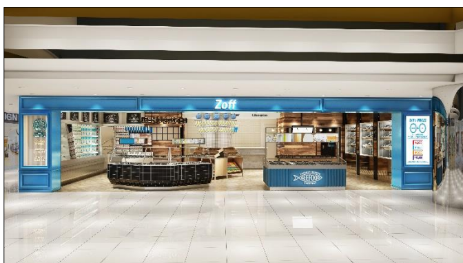
【店舗イメージ】▲Zoff 香港シティープラザ店

メガネブランド「Zoff」を運営する株式会社インターメスティック（本社：東京都港区）は、11月25日（土）、香港第1号店となるシティープラザ店をオープンします。同日には、ルミネ初の海外施設となる「ルミネシンガポール」にシンガポール第3号店をオープン。アジア各地で、日本のメガネカルチャーを発信していきます。