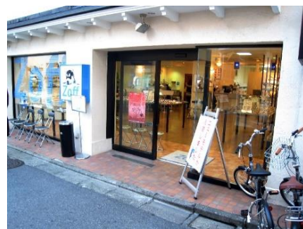
▲創業当時の Zoff 下北沢店

2001 年、下北沢に Zoff1 号店をオープンして以来、「メガネが主役の時代を作る」を理念としながら、当時業界内でも革新的であった SPA 方式を導入することで、「誰もがメガネを気軽に楽しめる社会」の実現をリードしてまいりました。しかし昨今では、市場の成熟により良質なメガネが手頃な価格帯で購入できることが当たり前となり、一方で、IT・AI などの技術進歩、with コロナ時代における新生活様式など、Zoff のメガネそのもの、またメガネをかけることについても、時代や社会の進化に応じた変化を迫られていると考えています。