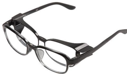
集中が必要なときはフードを装着