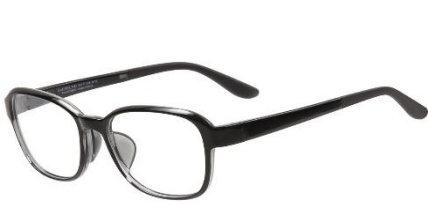
日常使いができるデザイン

メガネの内側にあるフードは簡単に着脱可能で、勉強やパソコン作業などの“集中”したい場面では、フードを装着することにより目の作業に集中しやすい環境を作ることができます。またフードを外すことで、普通のメガネとしても使用することができ、シーンに応じた使い分けが可能です。