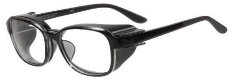
余分な視界をカットして目の前に集中！