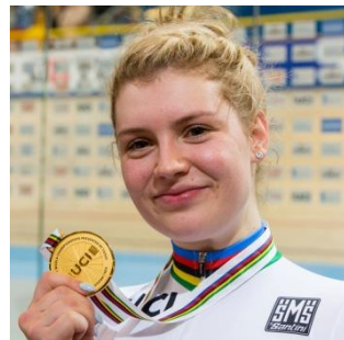
ニッキー・デグレンデル（22）

前回のTRACK PARTYでの走りが、目に焼きついた人も多いだろう。とにかく「強い」以外の言葉が見当たらず、圧倒的なパワーで飲み込んでしまう競走スタイルは、迫り満点。2018年スプリント世界チャンピオン。