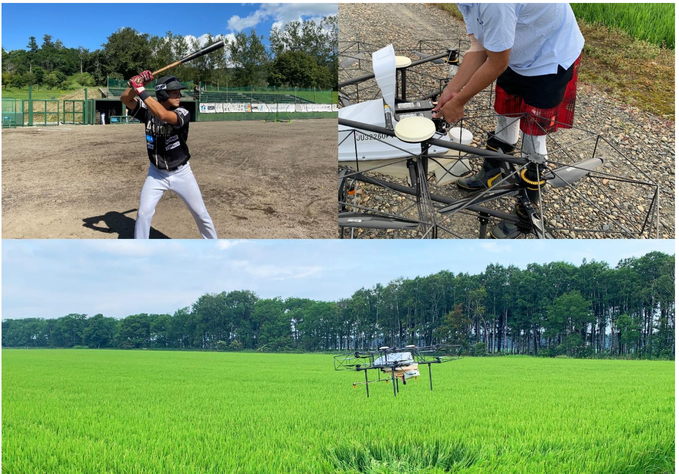
野球と防除作業を両立

美唄ブラックダイヤモンドズは、プロ野球独立リーグ・北海道フロンティアリーグに所属する北海道のプロ野球球団です。北海フロンティアリーグは「野球で、北海道の未来を拓きます。」をミッションに掲げ、地域活性化と人材育成を大切にしています。美唄ブラックダイヤモンドズは、地域密着型の球団として、プロ野球選手を目指す若者たちの移住定住や、選手のセカンドキャリアへのサポートに力を注いでいます。選手たちは、「with キャリア」として市内の企業などで働きながら、大好きな野球に打ち込み、自分自身の夢を達成するために、日々活動しています。その活動の一つとして、ナイルワークスのドローンによる防除作業に挑戦しています。