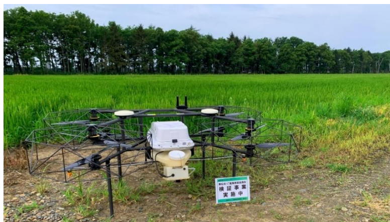
美唄市 ICT 農業推進協議会の実証事業の様子

近年、農地面積は大きく変わらない一方で、農家戸数の減少や農家の高齢化が進行し、農地集約化や法人化により営農規模が拡大しています。そのため、基盤整備による農作業の省力化・効率化を地域で検討・推進し、美唄市全体の推進組織がなかったことにより生じていた農業者間の知識・技術の差を縮めるため、令和元年、美唄市 ICT 農業推進協議会が設立されました。この美唄市スマート農業加速化プロジェクトにおいて、令和2年度にナイルワークスの農業用ドローンの技術検証が行われ、令和3年度よりナイルワークスは美唄市 ICT 農業推進協議会の一員となり、3年間、地域で持続可能な農作業モデルの構築を目指した実証事業を行っています。