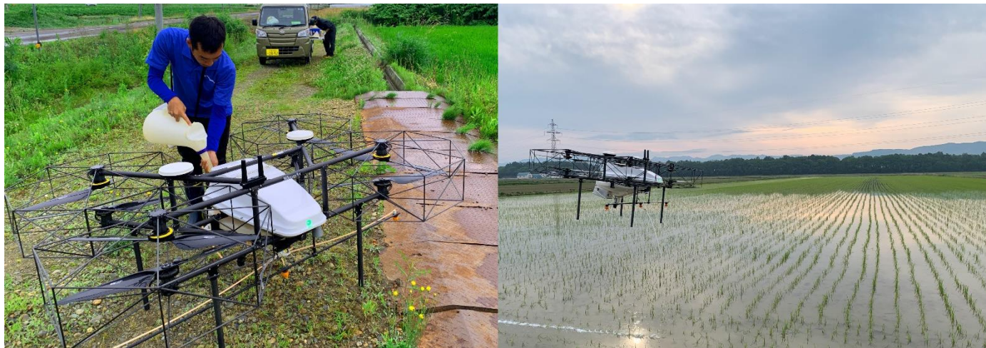
農業経験がなくても、自動飛行ドローンで安心して防除

「美唄ブラックダイヤモンドズの選手たちの労働力」と「ナイルワークスの自動飛行ドローン」により、地域で持続可能な農作業モデルの構築を目指します。地域の労働力で、地域の農業を盛り上げ、地域活性化と経済振興をはかっていきます。