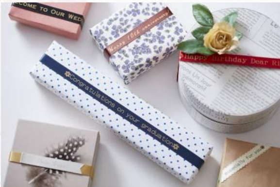
ー メッセージリボン ー