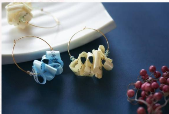
ー ピアス ー