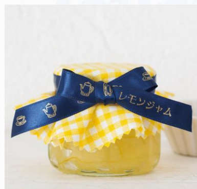
手作りプレゼントもアレンジ