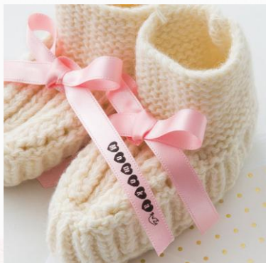
名前入りのオリジナルタグに