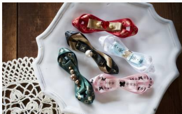
ー バレッタ ー