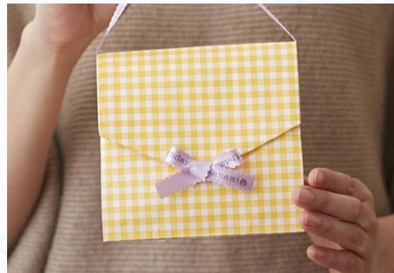
ー バッグ型ラッピング ー