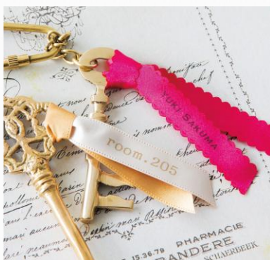
普段使いの小物をプチアレンジ