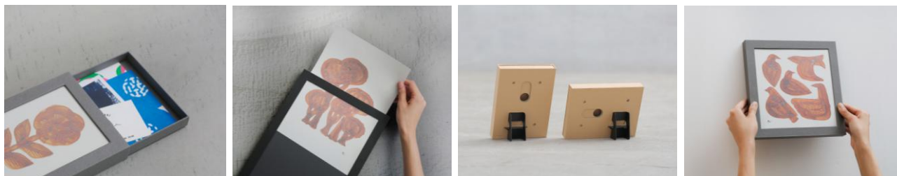
集めた“紙モノ”は収納箱に

コレクションした紙製アイテムを本体の収納箱にまとめて収納できます。収納箱は引き出し状で、深さは約2cm程あるので、子どもの工作など少し厚みのある作品も収納可能です。額縁への差し替えも簡単なので、気分に合わせて気軽に飾ることができます。また、付属のスタンドを使用して立てかけたり、背面の穴に紐を通して壁掛けしたりと、多様な飾り方でインテリアに合わせて楽しむことができます。