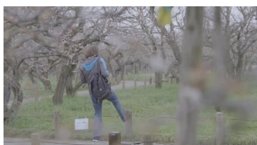
② 看板が理解できず、 立ち入り禁止場所にも 入ってしまう外国人 旅行者