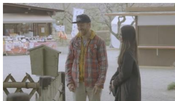
⑧ 多言語翻訳の観光案 内板を見て、笑顔を見 せる外国人旅行者