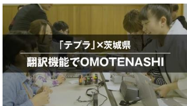
③ 「テプラ」が茨城県 とタッグを組み、 「OMOTENASHI」 プロジェクトを実施