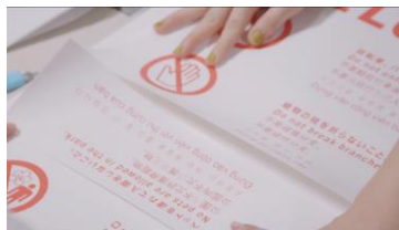
⑤ 完成した「多言語対応 の観光案内板」