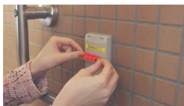
⑥ 借楽園内の看板が、 多言語翻訳に変わって いく