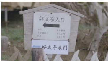
① 日本語表示のみの借 楽園内の看板