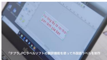
④ 「テプラ」PCラベ ルソフトの翻訳機能 を使って、多言語翻 訳が進んでいく