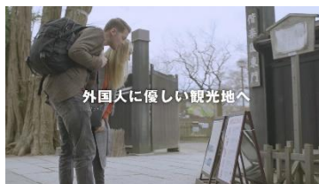
⑦ 外国人に優しい 観光地へ