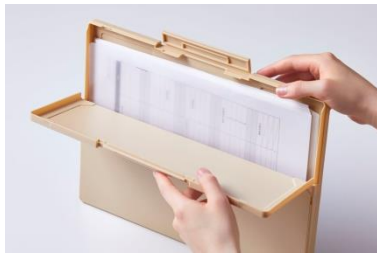
<ハーフオープン時>

片面を“ハーフオープン”にできるため、カバンの中にケースを入れたままでも、書類を取り出しやすい構造です。“ハーフオープン”部分はマグネットで簡単に開け閉めできます。“フルオープン”にすれば中身を一目で確認でき、カバンの中でも外でも便利に使える仕様です。