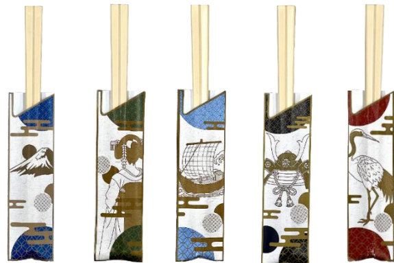
富士山 舞妓 船 兜 鶴