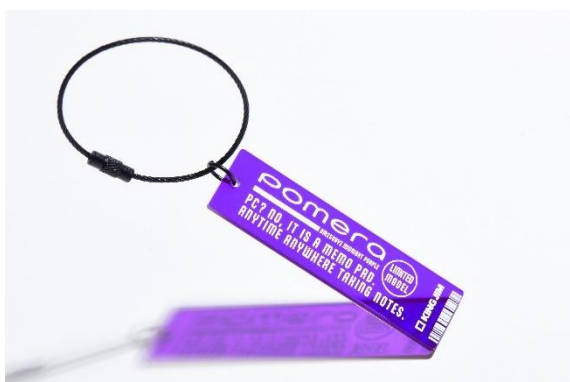
同梱品：限定アクリルキーホルダー（ロゴタグ）