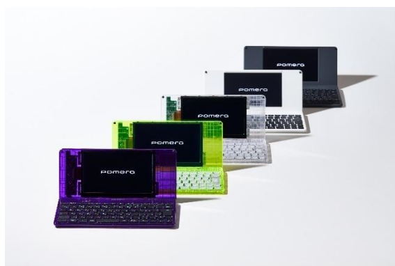
DM250 XYZ Midnight Purple（手前）と現行モデル（奥）過去の限定色（中）