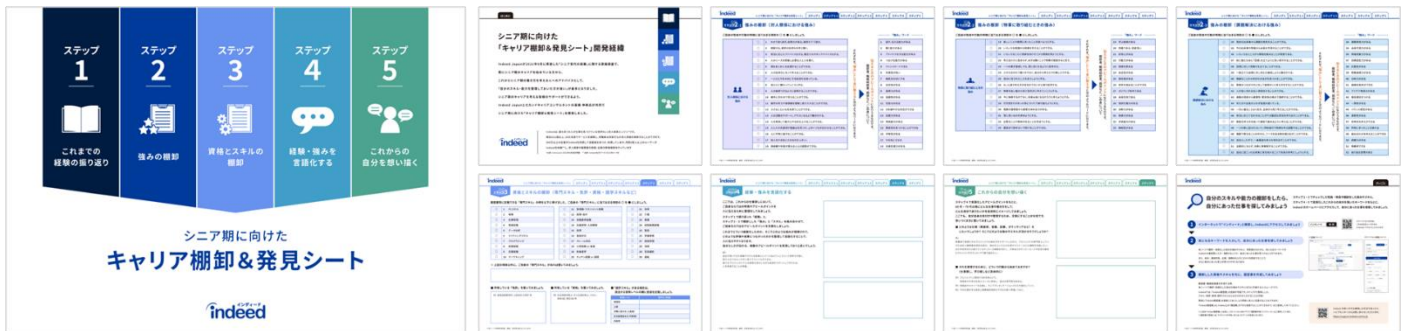
「シニア期に向けた『キャリア棚卸&発見シート』」