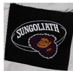
チームのエンブレムを刺繍した織ネーム