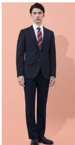
ネイビー無地 2 釦スーツ