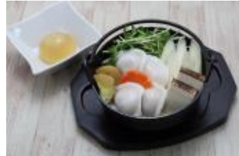
喰らえ！ アトミック・スプリットスラッシュ ～豆乳ギョウザ鍋／生姜スライム～ 690 円（税込 759 円）