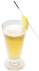
リスタルテ 450 円（税込 495 円）