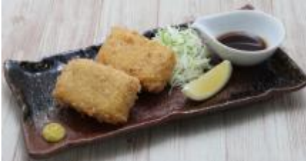
偽装（フェイク）カツ ～チーズin○○○○～ 350 円（税込 385 円）

喰らえ！アトミック・スプリットスラッシュ～豆乳ギョウザ鍋／生姜スライム～ 690 円（税込 759 円）