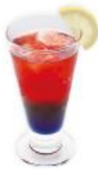
アリアドア 450 円（税込 495 円）