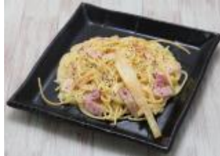
合成プラチナソーダ ～カルボナーラ～ 650 円（税込 715 円）