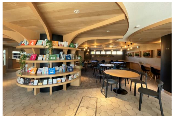
食堂とライブラリーサークル (図書スペース)