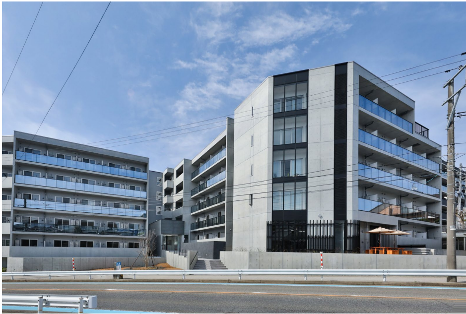
「Uni E'terna 新潟大学南」