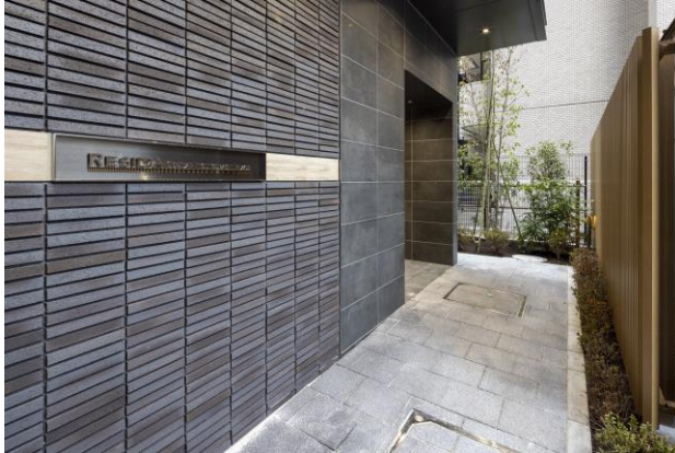
エントランスへのアプローチ