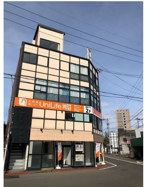
UniLife 福井店／福井大学（右奥）