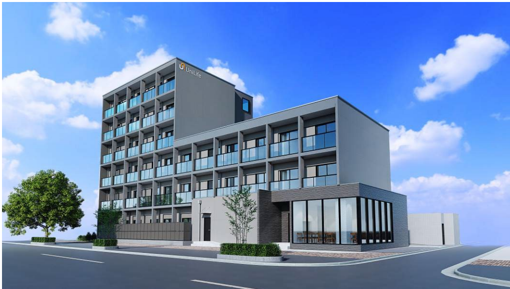
「学生会館 Uni E'meal 福井花月」