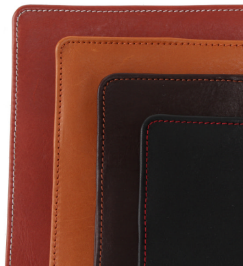
革と糸の組み合わせ例

「羽衣 -Hanegoromo-」は、大判の本革を贅沢に使用した、MacBook Air (11 インチ) 専用のジャケットカバーです。「羽衣 -Hanegoromo-」という名前には、MacBook Air の薄さや軽さを損なわず、本体をやさしく包み込んで保護する、羽のように軽い衣 (ジャケット) の意味が込められています。