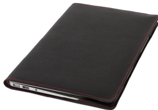
「羽衣 -Hanegoromo-」外観写真（革色：ブラック）

「羽衣 -Hanegoromo-」は、デザイン性はもちろん、カバーとしての機能性を第一に設計されています。170g という軽さと約 2mm の薄さで、MacBook Air 本来の薄さや軽さを損なわず、カバンに入れてもかさばりません。ジャケットカバーのため、カバンから取り出したらフタを開けてすぐに MacBook Air を使うことができます。外面には大判の 1 枚革を贅沢に使用しています。MacBook Air が触れる内側部分には高級スウェード生地を使用し、本体をやさしく保護します。また、革とスウェード生地の間にはごく薄手（1.5mm）のウレタンを入れており、外部からの衝撃をやわらげます。ウレタンが入ることで、やわらかな触り心地と、手にしたときの絶妙なフィット感を生み出しています。