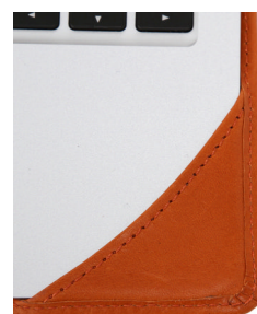
サイド部分のしなやかな曲線

デザイン性にすぐれた MacBook Air に合わせて、シンプルでスタイリッシュなデザインを追求しました。機械では作り出すことができないしなやかな曲線を、職人の熟練した技術で表現。均一な縫い目と美しい縫いあがりは、手作業で行うからこそ実現しています。