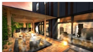
海神の湯(イメージ)

宿泊者専用の天然温泉 海神の湯（わたつみのゆ）が完備しており、大浴場には露天風呂・内風呂・塩サウナ・寝湯があります。旅の移動で疲れた体を天然温泉で癒し、寛ぎのひと時を楽しんでいただけます。