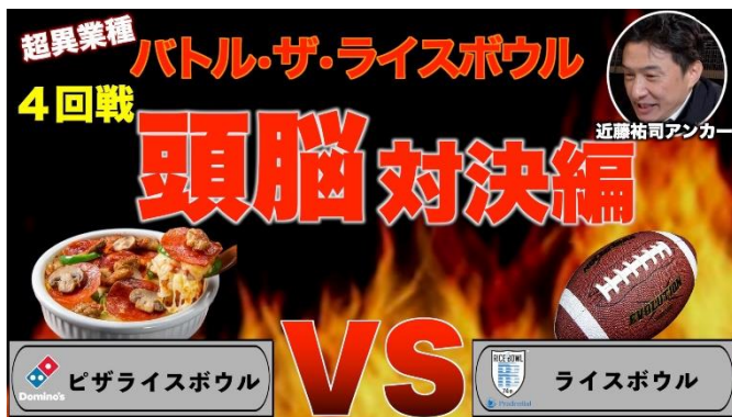
「バトル・ザ・ライスボウル」 4 回戦「頭脳対決」