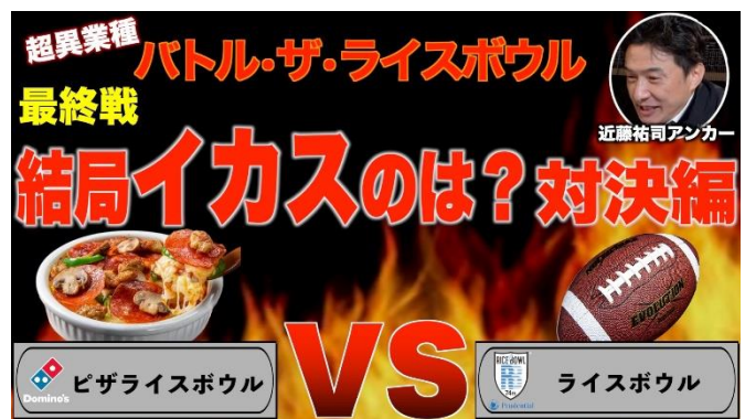
「バトル・ザ・ライスボウル」 5 回戦「結局イカすのは？対決」

ピザ vs. アメリカンフットボールという超異業種バトル「バトル・ザ・ライスボウル」は、2022 年 1 月 3 日の決勝戦「ライスボウル」開催に合わせて、12 月 13 日より 1 月 5 日まで 5 番勝負で行われています。