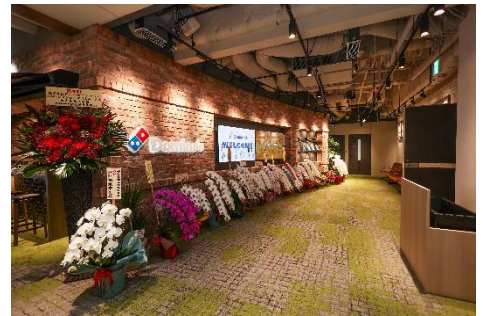
エントランス。大型ディスプレイで TV コマーシャルや映像資料を放映