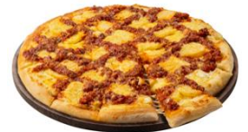
ニュージーランド産エグmontチーズのミートパイ風

エグmontチーズは、甘くてナッツのような風味があり、日本人の味覚にあったチーズと言われています。このチーズの美味しさを惹きたてるよう、ニュージーランドの国民食として広くご家庭で親しまれているミートパイをイメージしてピザに仕立てました。エグmontチーズとポテトに、新開発のポロネーゼソースを格子状にあしらひ、パイ生地を表現しています。