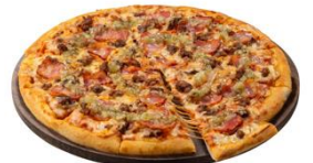
英国産プレミアムチェダーチーズバーガー風

英国の伝統的なチェダーチーズをスモークしたこの特別なオックスモークチェダーは、ビーフ100%のパティにとってもよく合います。さらに、スモーキーなベーコン、ピクルスを組み合わせ、定番のチーズバーガーの味と食感をまったく新しいピザの形で再現しました。ドミノならではの新しい美味しさをぜひお楽しみください。