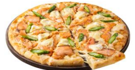
北海道産カマンベール&スモークサーモン

カマンベールチーズは"チーズの女王"と呼ばれています。北海道の生乳を使用して作られたカマンベールチーズのミルクシーな美味しさと、スモーキーでしっかりとしたうまみのスモークサーモンの組み合わせは王道の美味しさです。さらにシャキシャキのアスパラを加えることで、北海道の大地の味を表現しました。北海道に思いを馳せたドミノのピザの美味しさをぜひお楽しみください。