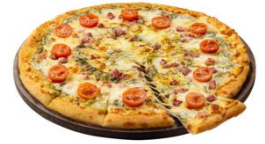
イタリア産パルミジャーノ・レッジャーノ&パンチェッタ

パルミジャーノ・レッジャーノは、"チーズの王様"と呼ばれ、あらゆる食材のうまみを引き立てる優れた調味料です。イタリアの人気食材であるパンチェッタ、トマト、バジルソースなど数々の食材を組み合わせることで、イタリアを強くイメージさせる逸品に仕上げました。イタリアの伝統的なピザの美味しさをお楽しみください。