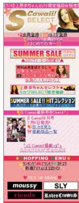
『S Cawaii!SELECT』 モバイルサイト TOP 画面

毎月発売される本誌のインデックスがひと目で分かります。また、最新ファッション情報が詰まったオリジナルのメルマガ配信も行います。その他、本誌に登場したアイテムの販売店MAPなども掲載します。