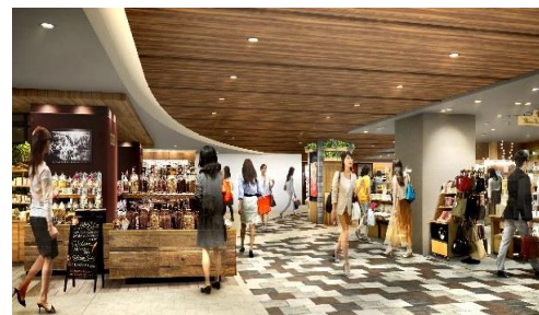
<本館 1F (イメージ)>

グランドフロアに位置する 1F には、 ファッション、雑貨、コスメ、ドラッグストア、コンビニエンスストア、和洋スイーツ、カフェ などデイリーからギフトまでバラエティに富んだショップを展開いたします。生活に欠かせないアイテムや日常に彩りをプラスするアイテムを取り扱い、千葉の「街にひらかれた」フロアとしてあらゆるライフスタイルに合わせた「便利で賑わいのある駅前ストリート」を演出していきます。