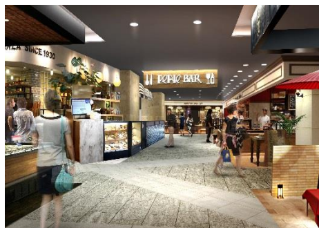
<ペリチカ バルゾーン (イメージ)>