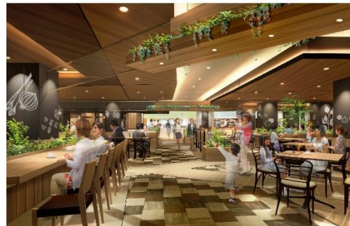
<本館 1F フードコート (イメージ)>

ファミリーからおひとりさままで幅広い利用シーンを想定し、 ファストフード などの人気ナショナルチェーンの飲食店を集積いたします。お食事や待ち合わせなど気軽に使える街の便利スポットとしてご利用いただけます。