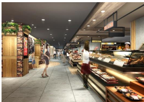
<ペリチカ (イメージ)>

本館及びストリート1の地下1Fは素材を通じて房総の旬を体感することのできる 生鮮食品 や、素材を活かした食料品、加工品を取りそろえ幅広いニーズに対応した グロッサリー 、専門店ならではの日常生活に寄り添ったメニュー提案を行う 惣菜 、定番の 和洋スイーツ などで構成。さらに千葉ならではのスイーツや巷で話題のブランドまで幅広く紹介する期間限定展開の イベントスペース も設置し、日々の食卓を彩ります。さらに、 バルスタイルの飲食ゾーン を設け、仕事帰りなどに気軽に立ち寄り、こだわりの料理とお酒をカジュアルに楽しむ空間を提供いたします。