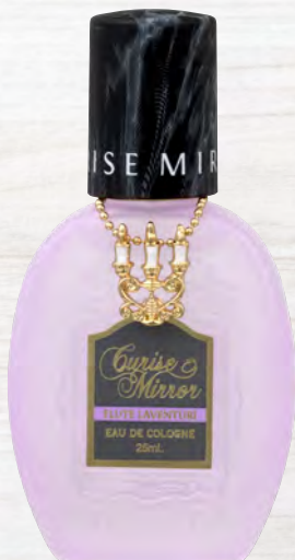
フルーティラベンダー

ジューシーなフルーツとラベンダーやローズなどの 華やかで柔らかなフローラルを合わせた、心地良さを 感じさせる香り。