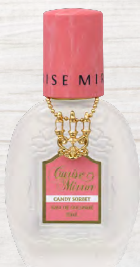
キャンディソルベ

ジューシーフルーツフローラル グアバのジューシーな若々しさと、ピオニーの繊細な イメージを重ねたフローラル・フルーティの香り。