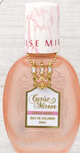
シトラスフローラルムスク

レモンやライム等を基調としたシトラスノートと フローラルノートのハーモニーが爽やかな香り。