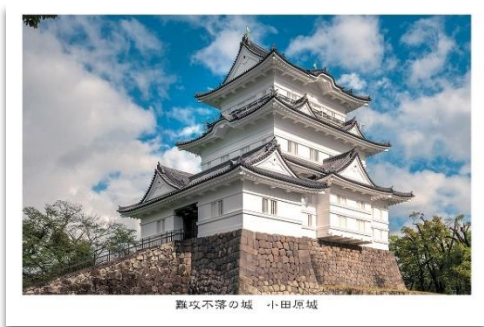
<小田原城限定 絵はがき>

※ダブル特典として、天守閣2Fの甲冑撮影スペースで写真撮影してSNSに投稿いただくと、「小田原城オリジナル缶バッジ」をプレゼントします。投稿画面を館内スタッフにご提示ください。