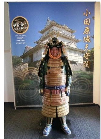
<甲冑撮影イメージ>