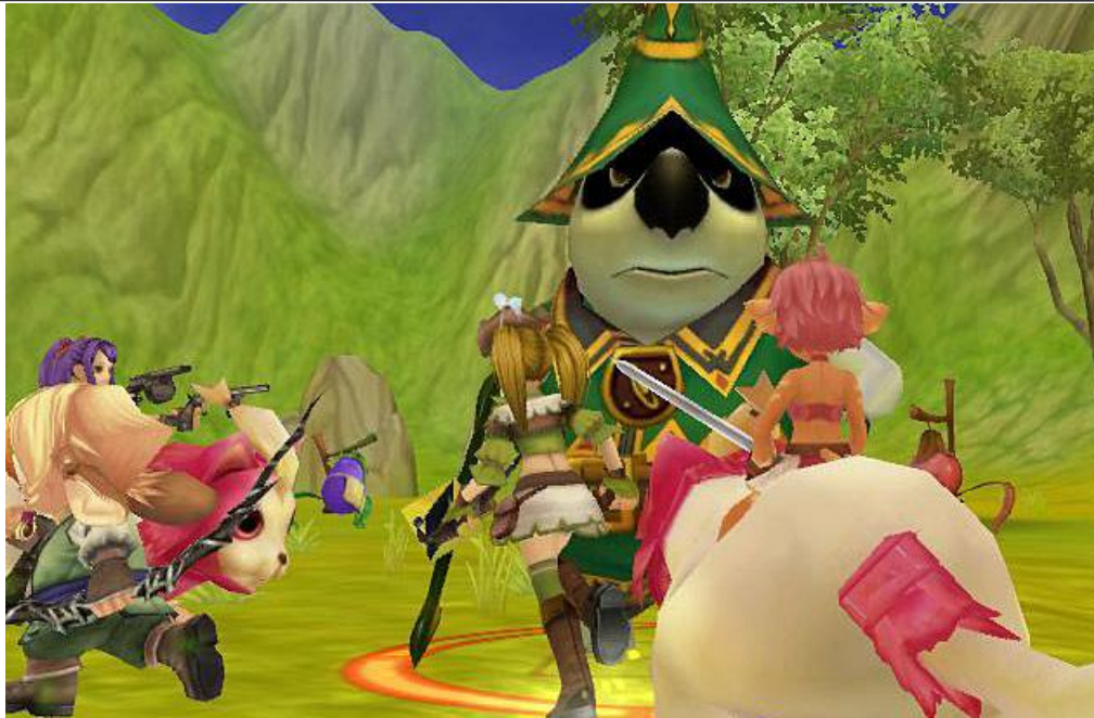
GBT 記念で開催された鬼沸きイベントでは協力して巨大モンスターと戦う姿が。

また、同時に開催されました『ルナティアプラス』を最高に面白いMMORPGに！』Twitterキャンペーンにおきましてもたくさんのご意見を頂き、誠にありがとうございました。皆様からいただきました内容については運営チームにて協議を重ね、最大限反映できるよう努力するとともに、特に要望の多かった以下の対応について完了したことをご報告いたします。