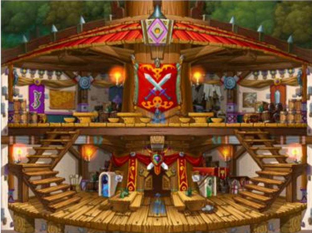
PvP/GvG設置専用コロシウム

更に、ゲーム本編だけでなくPvPシステムもゲームパッドに対応しておりますので、より一層格闘ゲームに近い白熱したバトルをお楽しみいただけます。