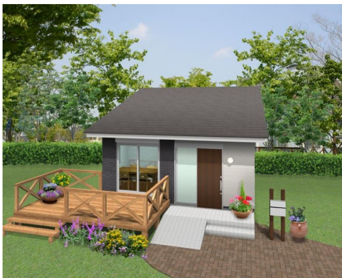
HANARE 外観イメージの一例

これらの問題を鑑み、エイブルでは、高齢者が今お住まいの広く大きな家は子育て世帯に賃貸として提供し、ご自身は同一敷地内にコンパクトで住みやすいHANAREにお住まい頂くことで、空き家を増やさず、高齢者には快適に住み慣れた土地で生活して頂ける本プロジェクトを開始いたしました。