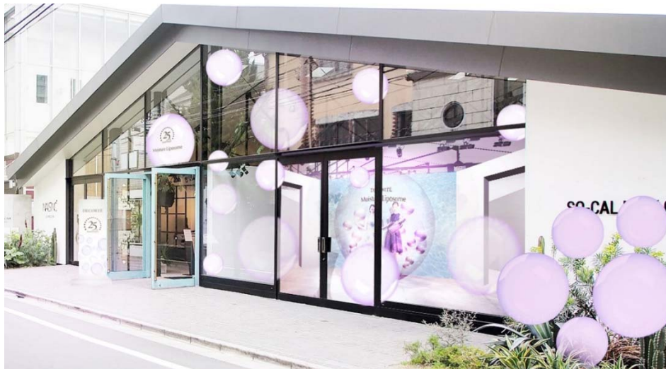
Moisture Liposome - Capsule Museum -外観イメージ