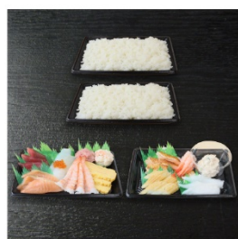
ファミリー手巻きセット 2,480円