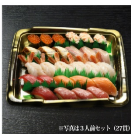
プレミアムセット 1人前 (9貫) 1,580円