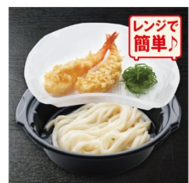
えび天うどん 1人前 420円

※価格はすべて税込です。 ※一部店舗では価格が異なります。 ※画像はイメージです。