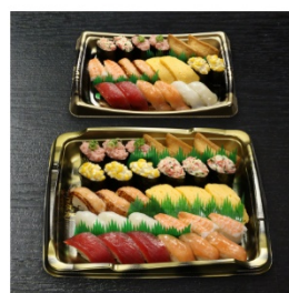
大サービスセット (50貫) 3,240円