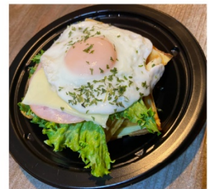
ハムエッグチーズワッフル 700円