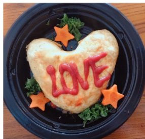
ハート型オムライス 900円