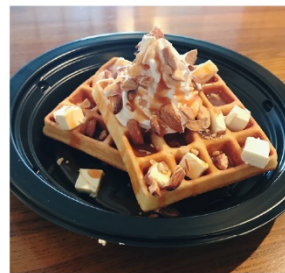
ハニーナッツクリーム チーズワッフル 540円