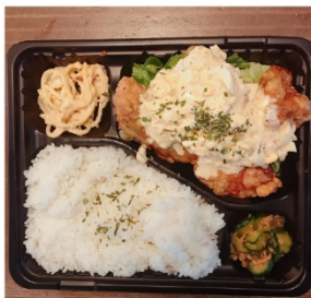
チキン南蛮弁当 750円