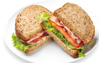
B・L・T サンド 590円