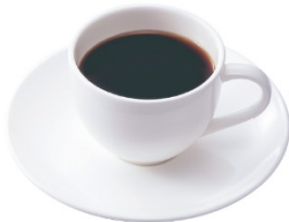
ネルドリップブレンドコーヒー レギュラーサイズ 530円