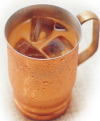
アイス黒糖ミルク珈琲 レギュラーサイズ 580円