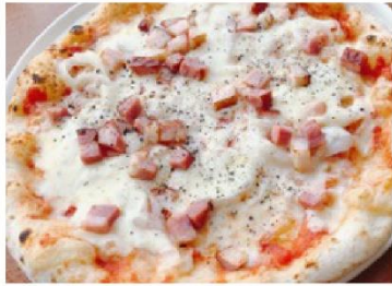
ピザ アマトリッチャーナ