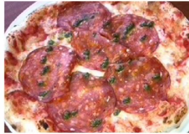
イタリアンサラミ バズルソース