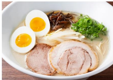
博多豚骨ラーメン (玉子のせ)