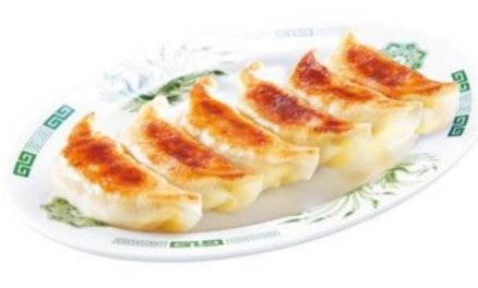
餃子 6個 300円