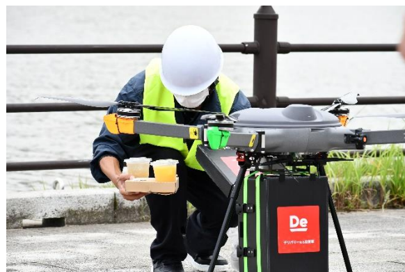
ドローンから注文商品をピックアップ