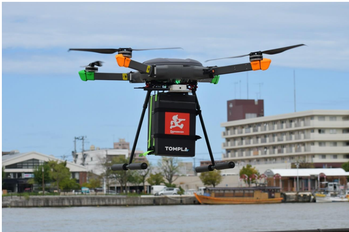
商品が入ったドローンが信濃川を越え、対岸へ