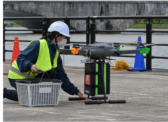
調理した商品をドローンにセッティング