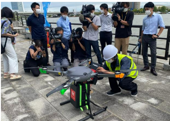
対岸の着陸ポートにドローンが到着