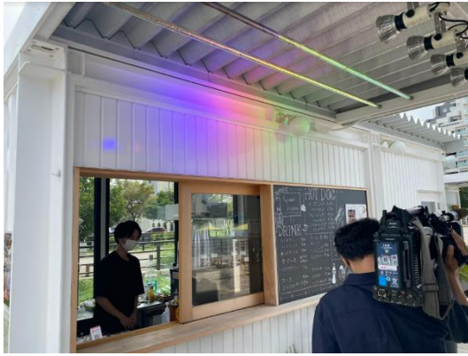
ハジマリヒロバ内レストランにて商品を調理