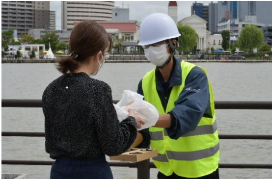
商品を注文したお客様へお渡し