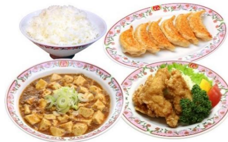
【デラックス】 麻婆豆腐セット 2,030円