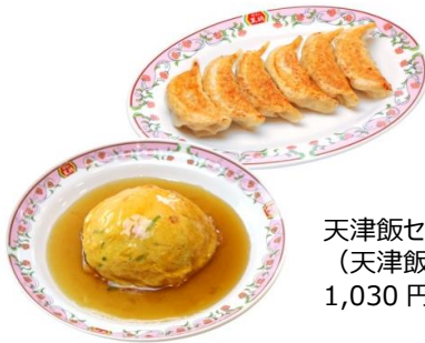
天津飯セット (天津飯・餃子) 1,030円