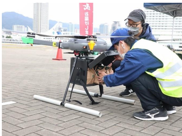
商品をドローンにセッティング