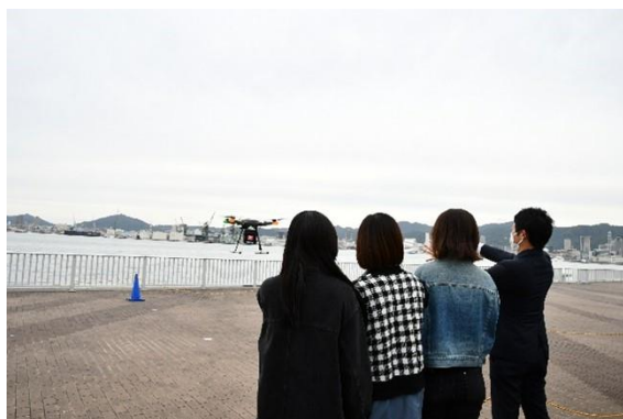
ドローン着陸の様子