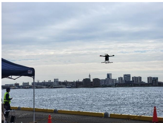
商品が入ったドローンが神戸港を渡ってポートアイランドへ