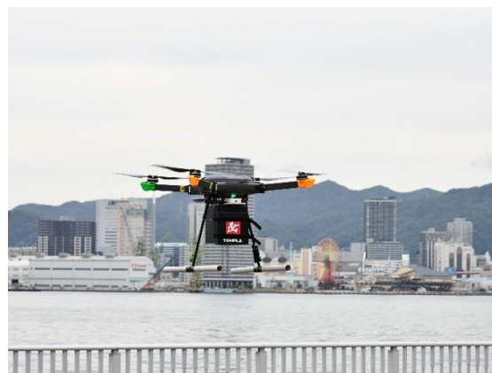
ポーアイしおさい公園にドローンが到着