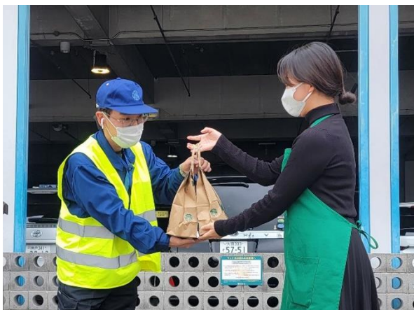
スターバックス コーヒー 神戸ハーバーランド umie MOSAIC 店 から商品を運搬