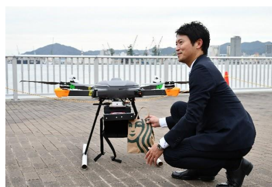
商品を受け取る兵庫県の斎藤知事