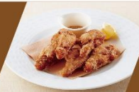
やわらか スパイシーフライドチキン 600円