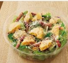
カリカリチエダの シーザーサラダ 730円