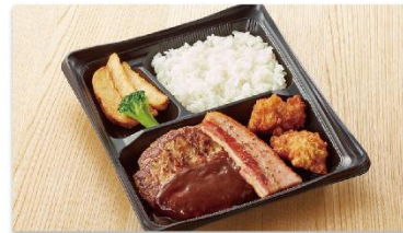
デミグラスハンバーグトリオ弁当 990円

赤ワインでじっくり煮込んだスペイン産豚肉を豪快にハンバーグの上のせ包み焼きにしました。ホイルを切り開いて召し上がれ！