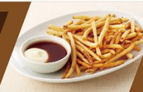
カリカリポテト (BBQ & マヨ) 400円