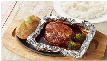
濃厚シチューソースの包み焼きハンバーグ (ライス付き) 1,200円

赤ワインでじっくり煮込んだスペイン産豚肉を豪快にハンバーグの上のせ包み焼きにしました。ホイルを切り開いて召し上がれ！