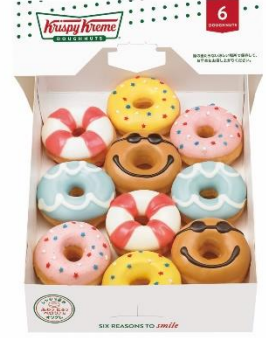
期間限定ミニ ボックス ハーフ (10個) 1,500円