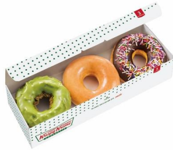
本日のおすすめボックス (3個入) 800円