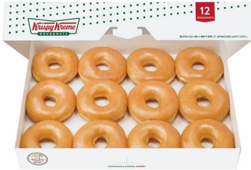
オリジナル・グレーズド® ダズン (12個入) 1,800円