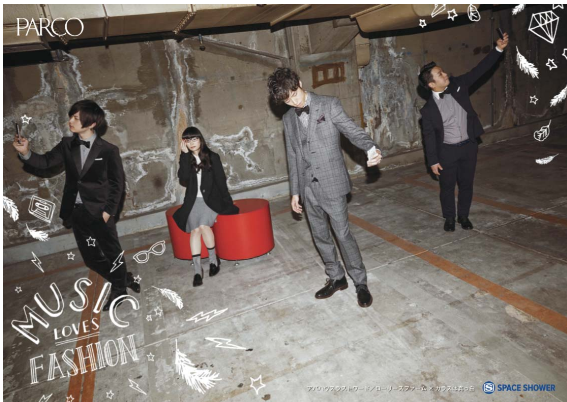
アバハウスラストワード/ローリーズファーム × カラスは真っ白