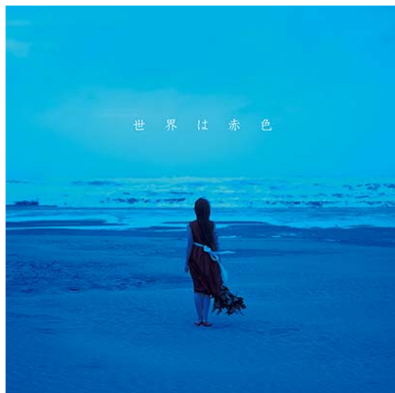
赤色のグリッター / 世界は赤色