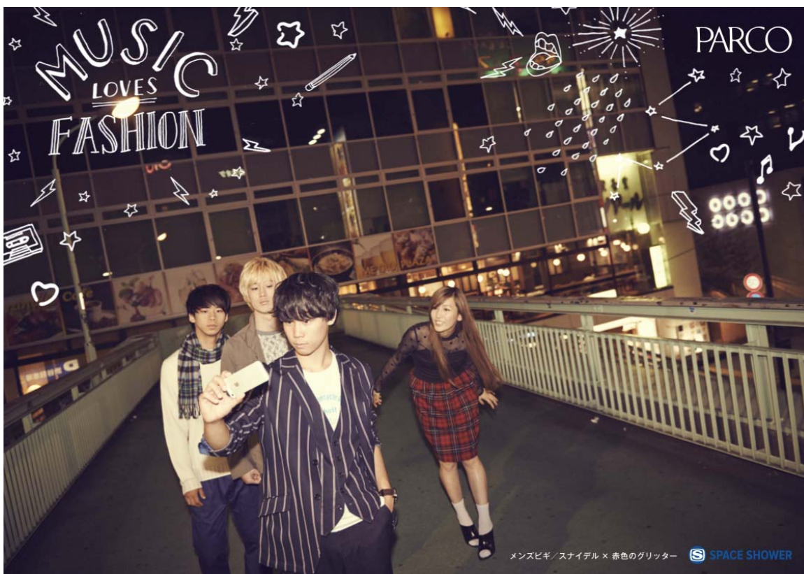
メンズビギ/スナイデル × 赤色のグリッター