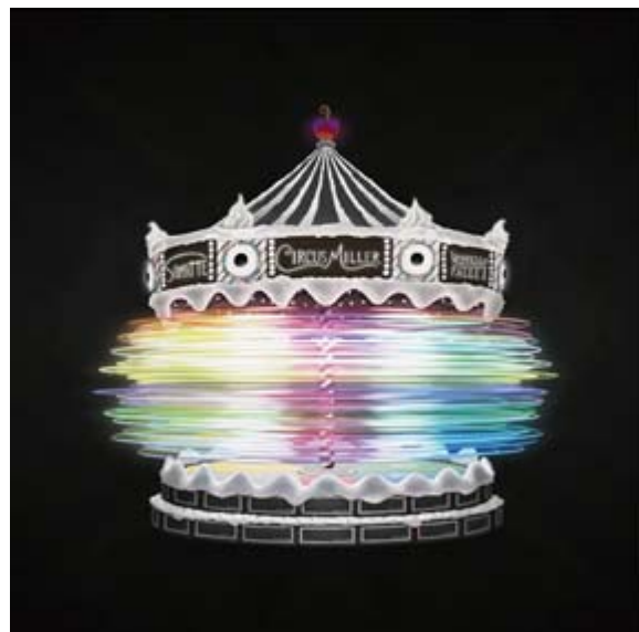
カラスは真っ白 / おんそくメリーゴーランド