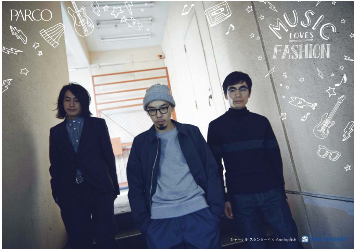
ジャーナル スタンダード × Analogfish