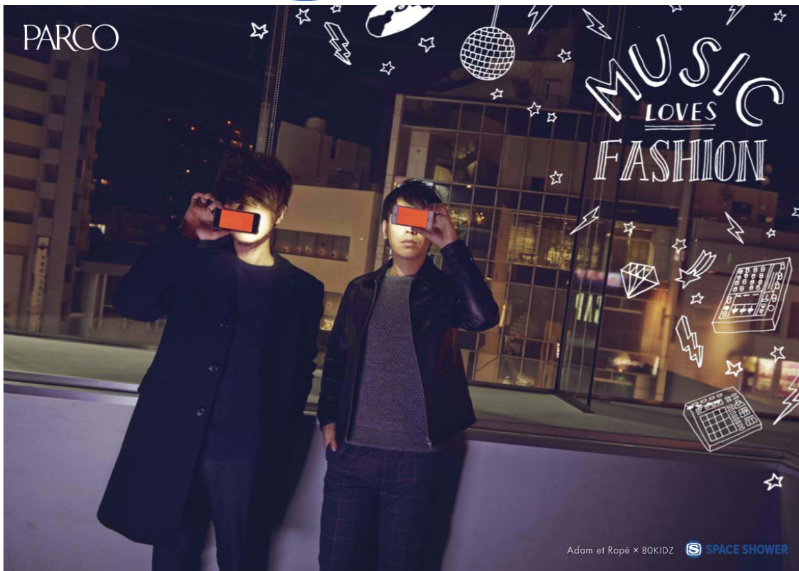
Adam et Ropé × 80KIDZ