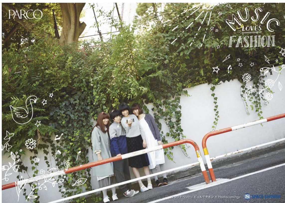
フレッドペリー/ビュルデサボン × Homecomings