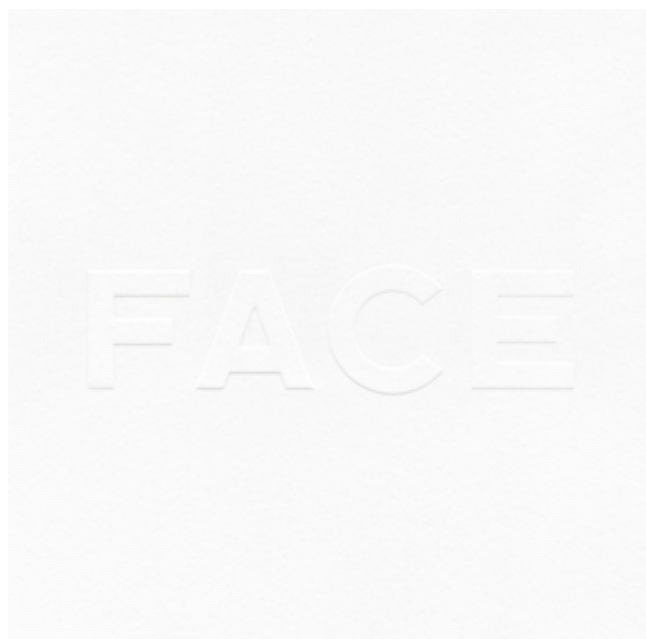
80KIDZ / FACE