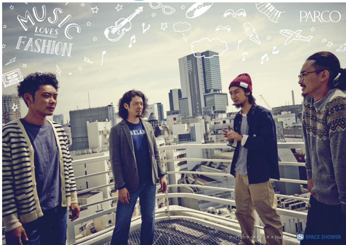
アーバンリサーチドアーズ × Nabowa