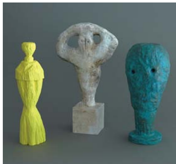
Analogfish / 最近のぼくら