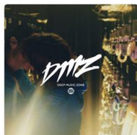
DMZ SPACE SHOWER