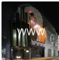
WWW SHIBUYA SPACE SHOWER