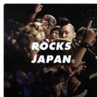
ROCKS SPACE SHOWER SPACE SHOWER