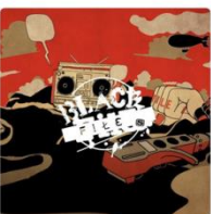
BLACK FILE SPACE SHOWER